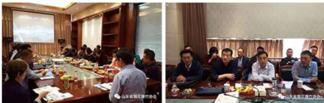
广信化工合作洽谈现场

3. 资产保值增值项目。8月至今，港湾（香港）金融服务有限公司已与部分会员（个人）达成保险定制服务协议。针对中低收入者，经过协会沟通，该公司拟定了年缴费在$3000-10000的危疾保障方案和家庭资产配置方案，更好的覆盖会员，提高会员资产和医疗保障力度。