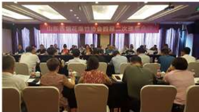
四届二次理事会现场