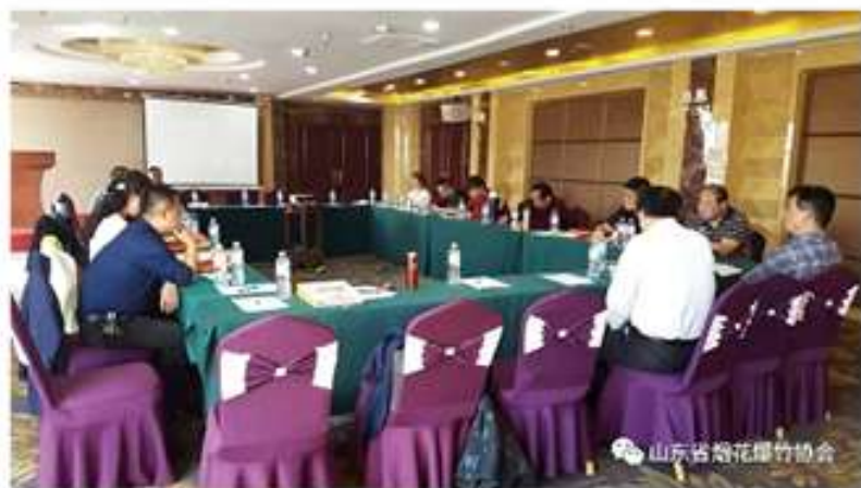
会长扩大会议现场

会议研究了烟花爆竹安全管理和“双重预防体系建设”等情况。会议要求，要坚持把安全生产放在一切工作的首位，严格落实安全生产主体责任，使企业在安全环境中稳步发展。