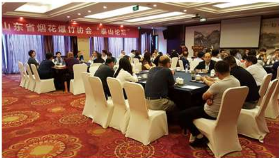
“泰山论坛”分组讨论现场

本次论坛得到了与会人员的一致认可，纷纷签字加入各项目，多元化工作进入实质性落地阶段。“泰山论坛”的圆满举办，既是对企业发展平台的成立检阅，也是对会员企业横向联合、纵向发展的重要尝试。今后，协会全力推动联合经营与多元化工作，及时协调解决项目推进过程中遇到问题，推动多元化工作的尽快实施，实现会员企业之间的联合发展、融合共赢。