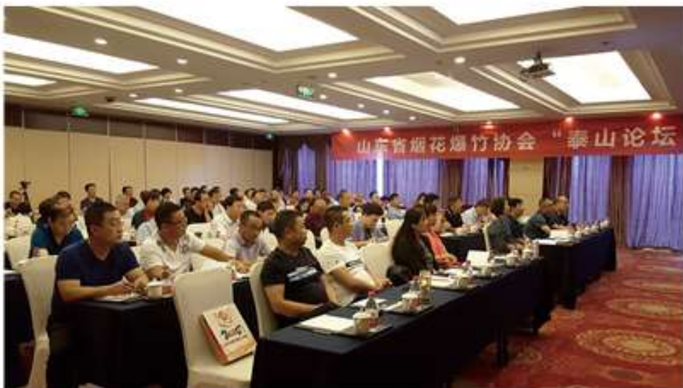
“泰山论坛”会议现场

“联合发展”是新时代烟花爆竹行业的主题，8月3日，山东省烟花爆竹协会在江苏宜兴举办“泰山论坛”，70多名会员代表围绕多元化发展与投资、财产保值增值等主题内容，共同探索“资源整合、优势互补”的切合点。