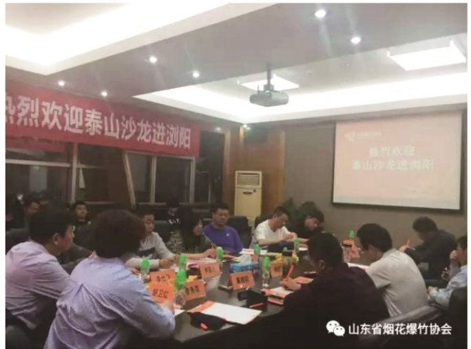
“泰山沙龙”进浏阳活动现场