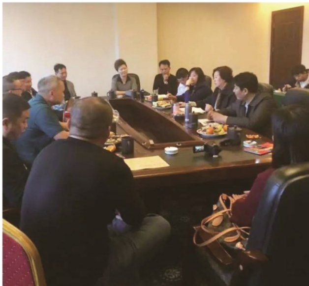
“泰山沙龙”进上栗活动现场