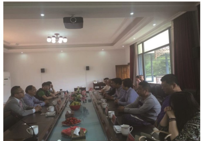
山东省烟花爆竹协会会长考察团在中洲烟花座谈交流

浏阳市中洲烟花集团有限公司始创于1992年，本着“诚心诚信，同心同行”的服务理念，经过二十多年的艰苦创业，现已发展成浏阳地区集上下游全产业链最强的烟花企业之一，拥有16个现代化生产基地，12万平方的现代仓储物流中心，连续8年领跑烟花市场，保持高速增长，全国优质经销商600多家，无论从销售绝对值还是客户质量均创下行业多个第一，中洲烟花以“立足行业榜首，争创世界品牌”为目标，一直坚持中高档产品中低档定价，价廉而物美，满足了不同层次消费人群的需求。