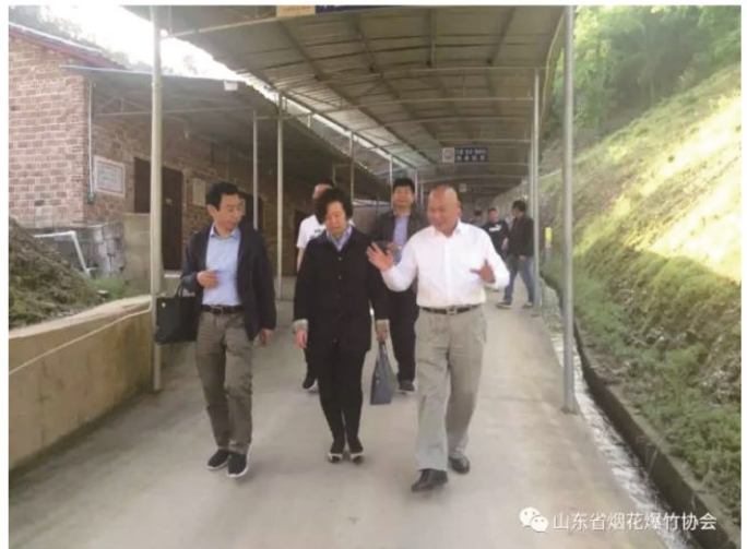
会长考察团参观东信烟花集团