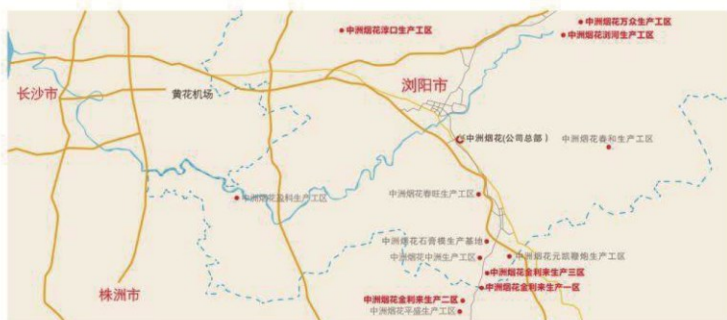
中洲烟花集团生产区域布局图

四、砥砺前行，中洲在路上， 新的一年中洲人更加务实，更为匠心，结交新朋友不忘老朋友，欢乐时刻总有中洲烟花，5200位中洲家人期待朋友的到来！