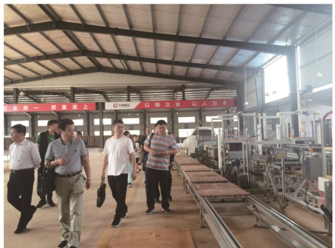
会长考察团参观中洲烟花集团