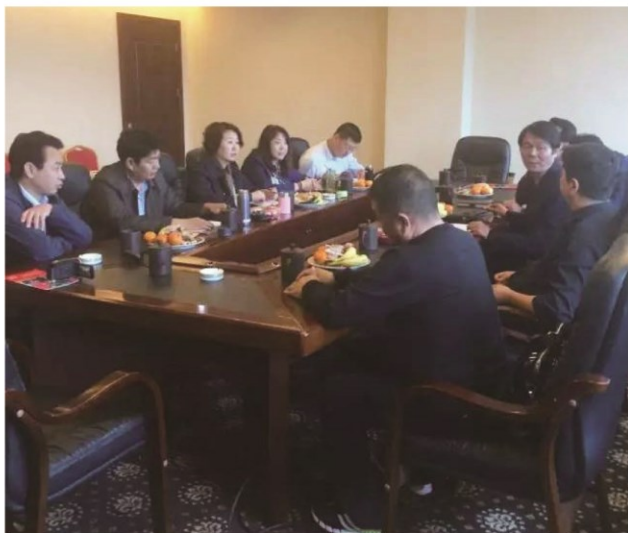
上栗政企座谈会现场

在20日晚间举办的“泰山沙龙”进上栗活动现场，与会企业代表畅所欲言，交流了产品设计、市场宣传、引导年轻人消费等内容。