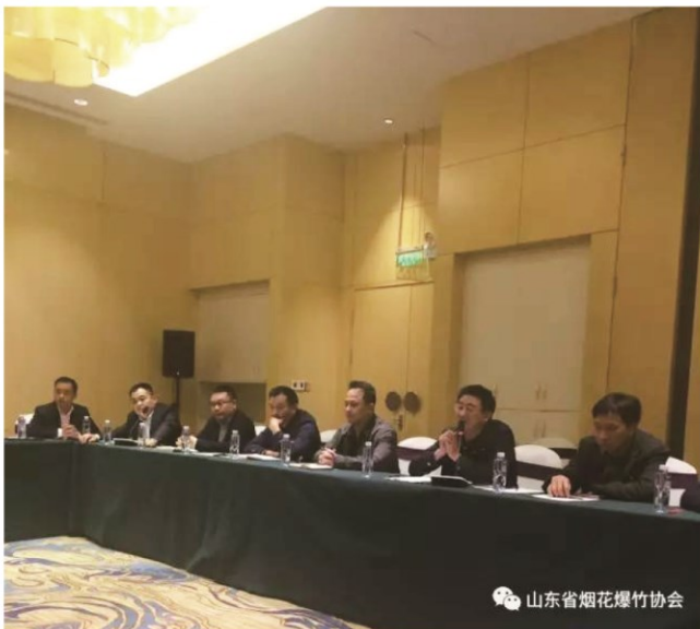
醴陵政企座谈会现场

4月21日上午，考察团在醴陵召开政企座谈会，醴陵市公安局、安监局、花炮局、花炮商会和部分生产企业负责人参加会议。