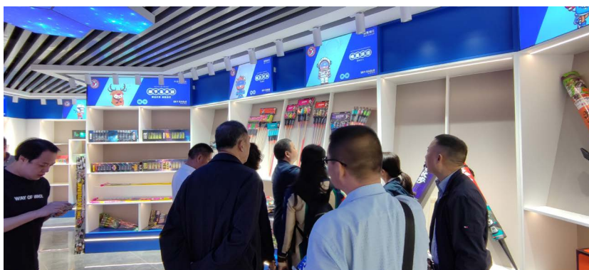
△协会参观考察当地企业