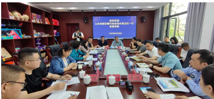
△协会与上栗县政府相关部门座谈交流