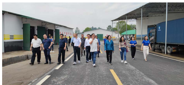
△协会参观考察当地企业