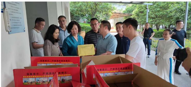
△协会参观考察当地企业