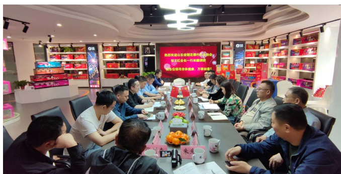
△协会与醴陵市政府相关部门座谈交流

考察期间，协会与醴陵市公安局、应急管理局、醴陵烟花爆竹发展研究中心、陶瓷烟花中心、烟花鞭炮总商会等单位举行座谈会。交流产区支持政策、安全监管、行业发展和山东省烟花爆竹政策监管动向等内容，通报相关行业问题。双方就严格道路运输管理、打击非法运输、举报违规行为等交换了意见。