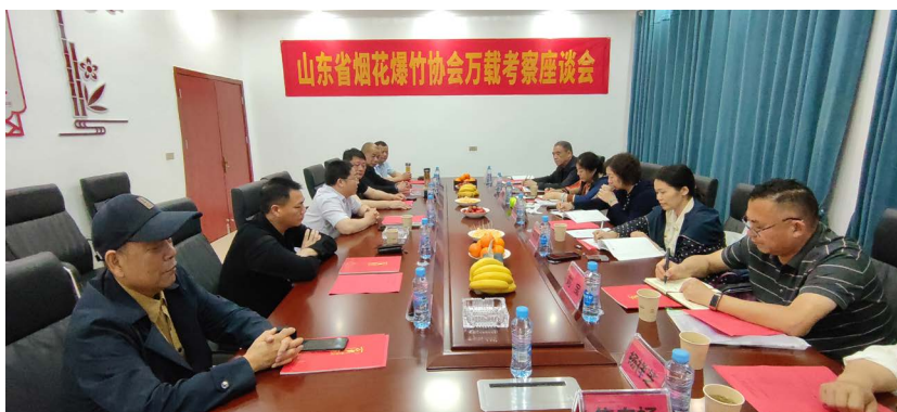
△协会与万载县政府相关部门座谈交流