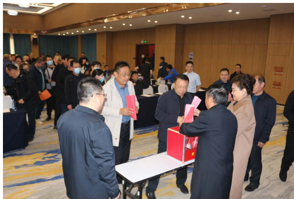
△与会会员认真投票