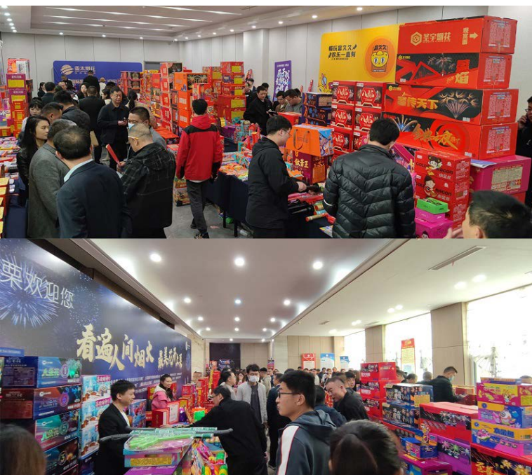
△烟花爆竹交易会展厅

今年以来，烟花爆竹行业迎来良好开局，协会积极响应会员诉求，提前召开交易会。本次交易会吸引了汹涌人潮车流，得到了省内外近300家企业踊跃参与。烟花爆竹展厅扩大3次后，满足了熊猫烟花、圣姑烟花、李渡烟花等70多企业参展需求，展示了国潮国风、时尚潮玩等一系列网红畅销产品；同时，“城市烟花”“玩具烟花”“环保烟花”“传统鞭炮”等低空低药量产品继续占据主导地位。