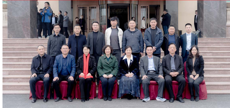
△山东省烟花爆竹协会第五届领导班子