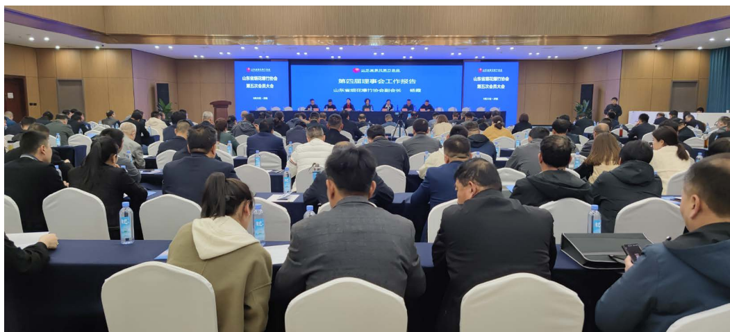
△山东省烟花爆竹协会第五次会员大会

经省民政厅核准，山东省烟花爆竹协会第五次会员大会3月22日在济南召开，200多名会员参加大会。