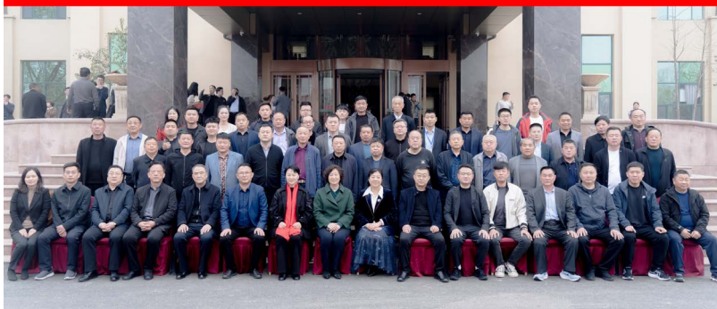
△山东省烟花爆竹协会第五届理事、监事