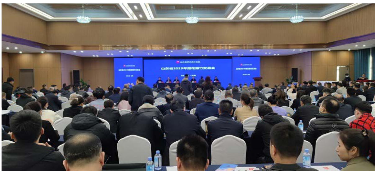
△山东省2023年烟花爆竹交易会

乘势而上，同心同行新征程。3月21日至24日，山东省烟花爆竹协会秉承简约、务实、热情、高效原则，举办了一届高质量、有特色的交易会。