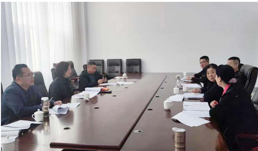
△协会2023年会长会议在济南召开