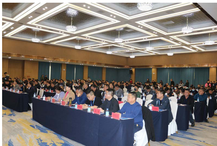
△山东省2023年烟花爆竹交易会

奔向春天的行程已开启，刚刚拥抱过高光时刻的烟花爆竹行业，将迎来更广阔的空间、更光明的前景。这次盛会，让新朋老友相聚，充分感受到山东市场活力，协会将抢抓机遇，在新一届领导班子带领下，加快推动行业绿色、创新、高质量发展，实现“蓝天与年味共存”。